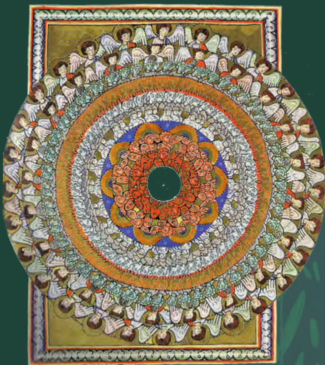
„Chor der Engel“ aus Scivias I.6, Rupertsberger Codex fol. 38r